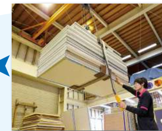
工場内天井のホイス