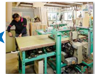
既存機械(東海ツインロボ12) 返し縫い