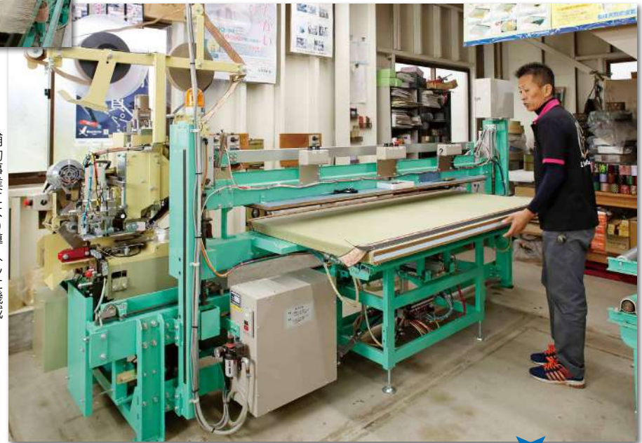
補助事業により導入した機械 (全自動反転式平刺機・東海ロボオート60B型) 「セット・上前平刺」「下前平刺・隅止め(上前)」「 隅止め(下前)」