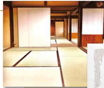
い草の産地熊本県から「熊本県産畳表応援店」に認定されました